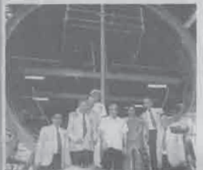
Defence Minister Manohar Parrikar poses with officials after inaugurating submarine assembly workshop in Mumbai on Saturday.

ther advanced technology would be made available".